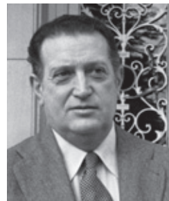
Fernando Álvarez de Miranda.