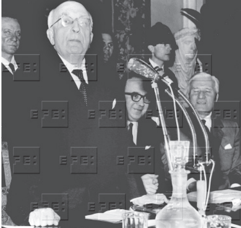
Salvador de Madariaga, durante una conferencia en Roma en 1965.