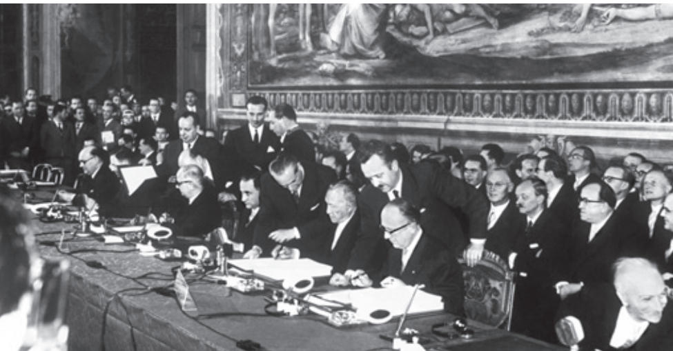
Firma del Tratado de Roma celebrada en Roma el 25 de marzo de 1957.

En respuesta a esta solicitud, el diputado Willy Birkelbach presentó una interpelación ante la Asamblea Parlamentaria de la CEE el 30 de marzo de 1962, en la que, tras afirmar que “resulta, pues, increíble que la Comunidad Económica Europea llegue a