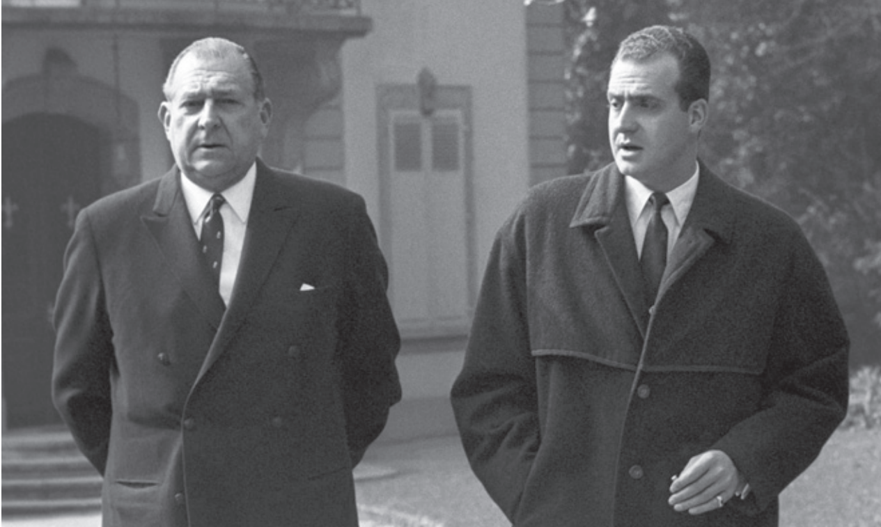
El Conde de Barcelona y el Príncipe Juan Carlos, en una fotografía tomada en Suiza en 1969.

hasta el final. Ahora bien, quiero que el Conde de Barcelona sepa que, si la Corona, de hecho, facilita el tránsito pacífico a la democracia, el PSOE, a partir de ese momento, respaldará a la Corona”.